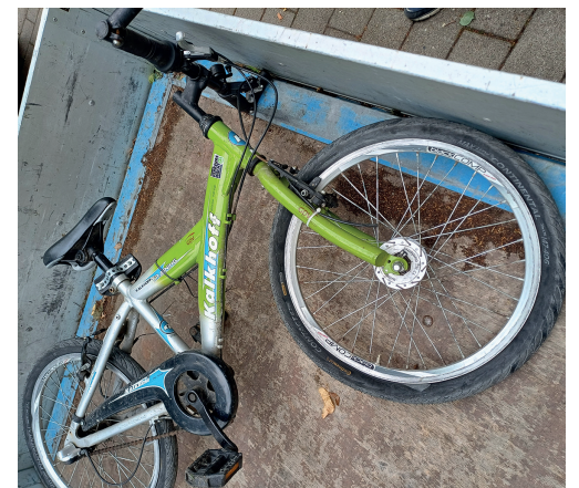
Fundort: Gebüsch am Haltepunkt Nünchritz