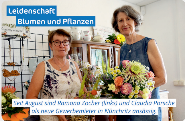
Leidenschaft Blumen und Pflanzen