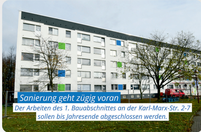
Sanierung geht zügig voran Der Arbeiten des 1. Bauabschnittes an der Karl-Marx-Str. 2-7 sollen bis Jahresende abgeschlossen werden.