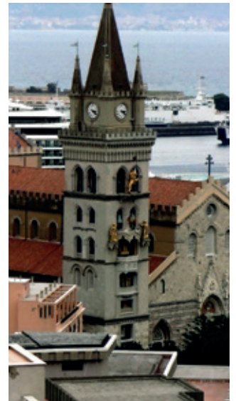
Glockenturm am Dom von Messina

ten dort. In 2) ist zu lesen: „Die Normanen behielten die multinationale, tolerante Gesellschaftsordnung der Araber bei. Sie übernahmen sogar das Verwaltungssystem ihrer Vorgänger. Am Hof waren jüdische, arabische und griechische Wissenschaftler, Künstler, Gelehrte und Beamte wohl angesehen.“ Was damals möglich war, scheint Jahrhunderte später nicht mehr möglich zu sein? Wer Venedig und auch Padua (2014) besucht der ist von der Pracht dieser Städte beeindruckt, erlebt aber auch das Kreuzfahrtschiffe protzig am Zentrum Venedigs vorbei geleitet werden und sich für Stunden das Leben der Einheimischen schlagartig ändert. Als wir auch Sardinien und Korsika bereisen konnten, nutzten wir dies 2017 und 2019. Beide Inseln etwas abseits von ihren Ländern Italien und Frankreich werden von Menschen bewohnt die sehr selbstbewusst ihre geschichtlich gewachsenen Eigenarten erhalten wollen. So konnte ich im Norden Sardinien keine mehrstöckigen Hotels an den Stränden entdecken. Man schuf z.B. der natürlichen Landschaft angepasste Urlaubsbereiche. (Abb. Sardinien 2017) Die touristische Erschließung dieser Inseln hält sich bisher in Grenzen.