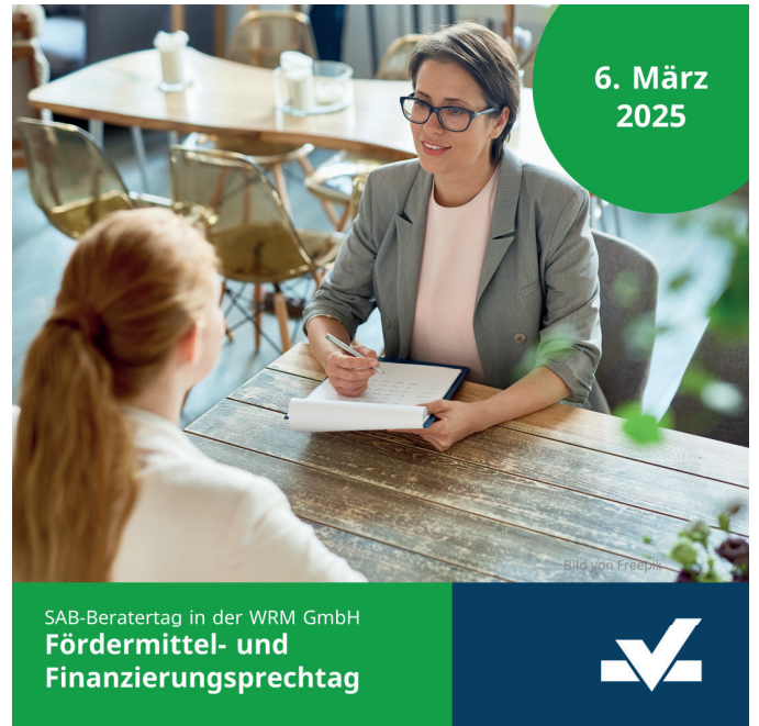
SAB-Beratertag in der WRM GmbH Fördermittel- und Finanzierungssprechtage

Vorabinformation: www.wirtschaftsregion-meissen.de/aktuelles/veranstaltungen.html