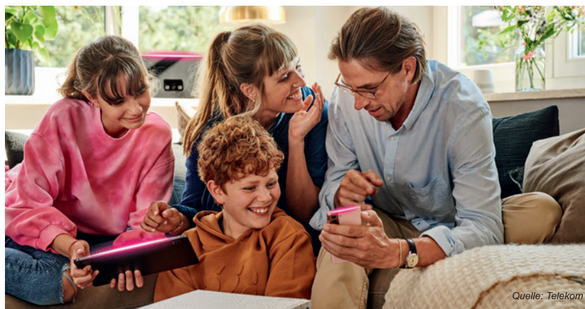
Für rund 1.270 Haushalte in Ortsgebiet Nünchritz baut die Telekom gemeinsam mit der GlasfaserPlus das Breitbandnetz aus.

Gut zu wissen: Die Glasfaser-Tarife der Telekom bieten viel Bandbreite zum fairen Preis. Dabei profitieren